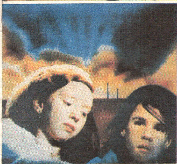
ИСТОРИЯ ОДНОЙ ВСТРЕЧИ